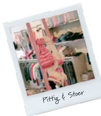
Pittig & Stoer